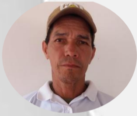
Saúl Benito Hoyos Caldera Presidente